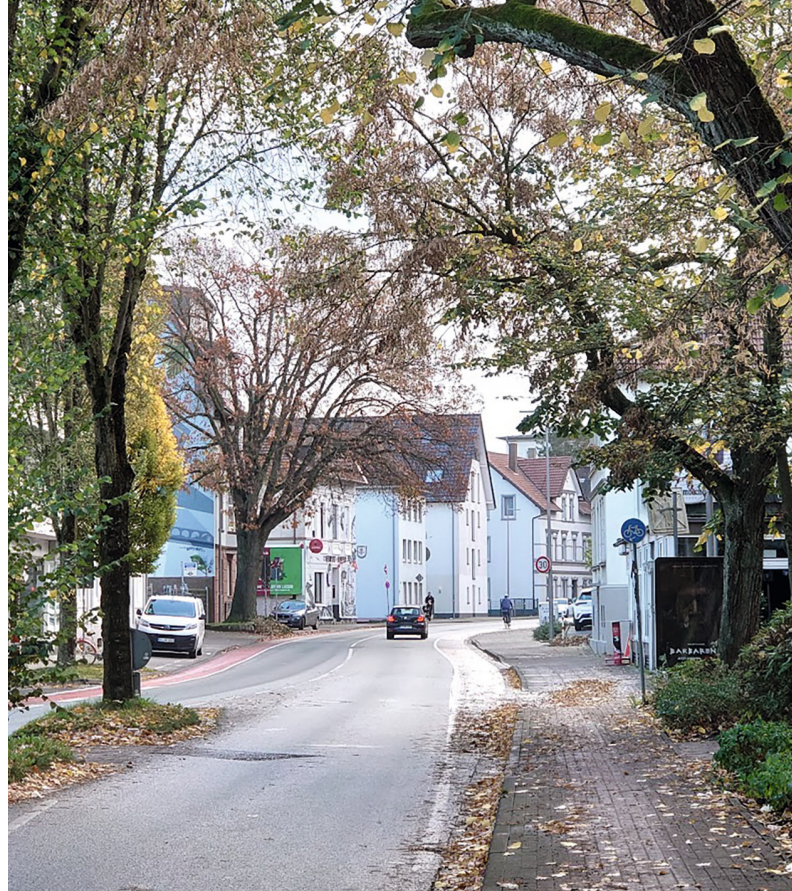
Die Stapenhorststraße mit Blick Richtung Innenstadt