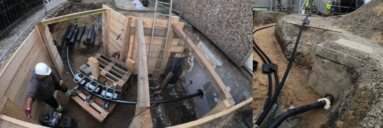
Einzug eines 110.000-Volt-Kabels