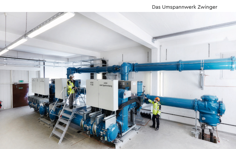
Das Umspannwerk Zwinger